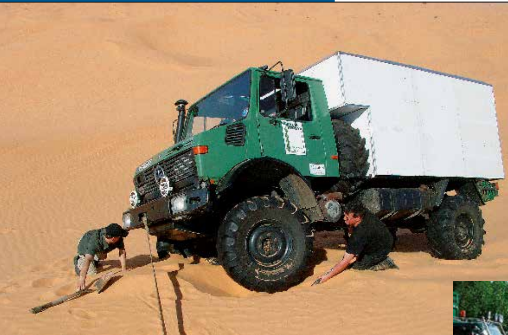
[30] Unimog in der Sahara