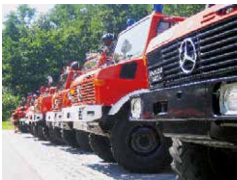
[28] Treffen der Feuerwehren