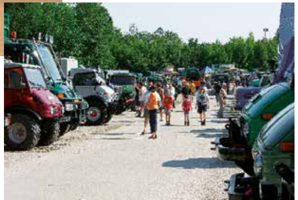
[10] Unimog-Treffen in Ampfing