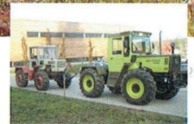
[16] MBtrac-Matinée im Unimog-Museum