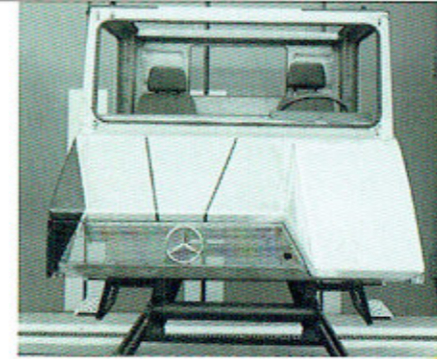
[24] Die Frühzeit der Unimog Versuchswerkstatt Teil IV