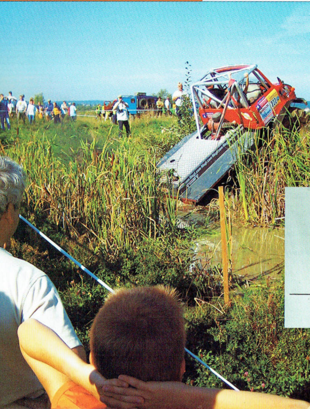
[12] Unimog in Aktion beim 10. Treffen in Weidhausen