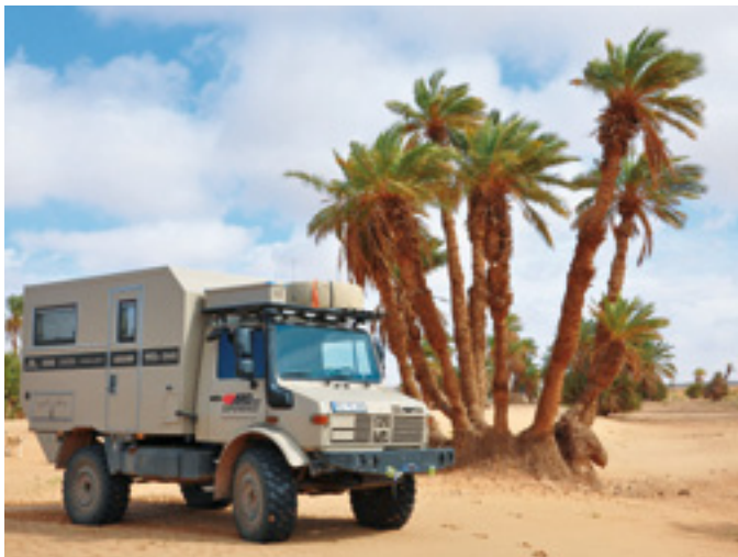
[34] Expeditionsmobil im Eigenbau