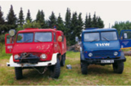
[44] Klein- anzeigen