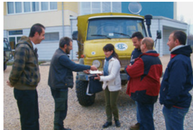
[42] Der Unimog im humanitären Einsatz