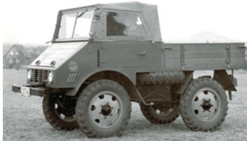
[26] Schwerpunktfahrzeug „Boehringer“