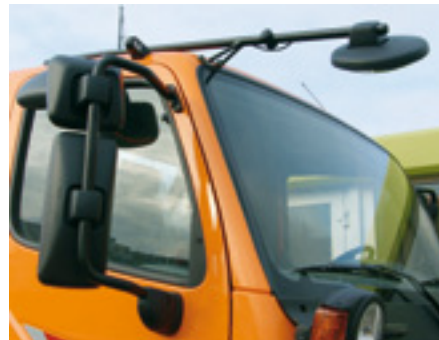
[51] Quiz Nr. 75